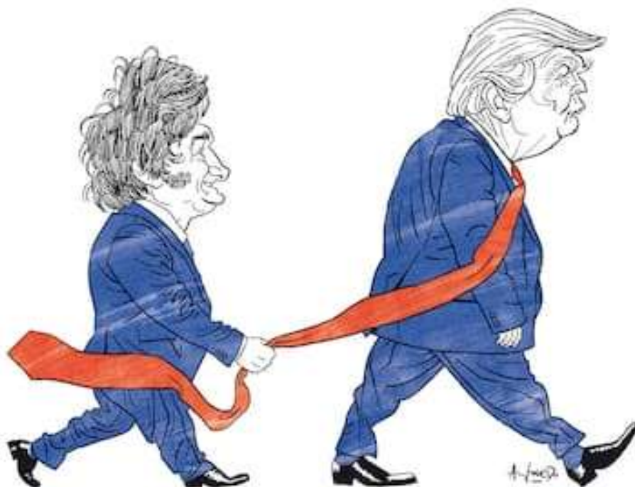
Jaime Rosenberg, "El Gobierno se ilusiona con un vínculo 'privilegiado' con Trump, aunque Washington pondrá condiciones", La Nación , 1° de febrero de 2025.