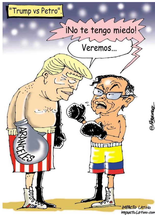
"Trump vs Petro", Impacto latino , 30 de octubre de 2025.